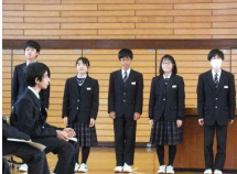
意欲満々 生徒会執行部