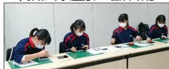
<川連漆器 沈金・絵巻体験>