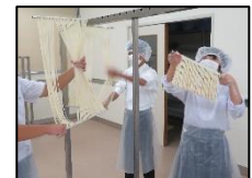
<いなにわうどん体験>