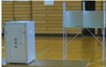
本物の投票箱と記載台