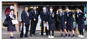
<角館武家屋敷の班別研修>

5月に東京方面を予定していましたが、行き先を秋田県内に変更して10月に実施しました。旅行中、3密の回避、消毒、手洗い、検温など細心の注意を払い、秋田の魅力再発見、秋田の経済の活性化への貢献をコンセプトとし、県内を北から南へ縦断する二泊三日の行程で行いました。仲間との絆が深まり、体験学習やインタビュー等を通し、働く意味や生き方などについて、考えを深めることができました。保護者の皆様のご理解とご協力のお陰で実施できたことに、深く感謝申し上げます。