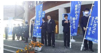
▲新執行部と学年委員による挨拶

10月20～22日に美里小で小中合同挨拶運動が行われました。生徒会執行部と学年委員会の生徒が美里小に行き、挨拶の大切さを先輩から小学生に伝えるべく、早朝から元気な挨拶を届けてきました。「いのちの教育あったかエリア」事業で作成した「のぼり」も秋空にまぶしく揺れています。このように後期生徒会が瀧西中の伝統という名のバトンをしっかりと受け継ぎ、力強い一歩を踏み出しました。新体制に大いに期待しています。