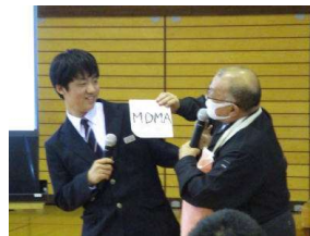
▲薬物勧誘拒否のロールプレイ

男鹿署やチャイルド・セーフティ・センターから4名の講師をお招きしました。この教室は、心身の健康で安全なライフスタイルの形成を目標に掲げ、薬物乱用の防止による知識等の理解を通して、適切な行動や判断ができるようになることを目指しています。生徒は講話やロールプレイなどを通して、理解を深めました。