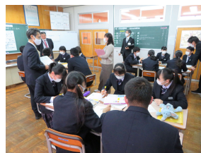
▲ 3年特別活動 グループ協議