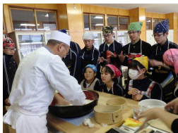
【技を学ぶ、真剣な眼差し】

講話では、ご退職なさってから、なぜそば打ちを始めようとしたのか、なぜ適さない場所であえてそばの栽培に挑戦しようと思ったのかなどのお話を伺いました。そして「やってみたいことやチャンスがあったら、まずは飛び込んでみよう」というメッセージをいただきました。これから、自分の将来を選択していく2年生にとって、元気と勇気をいただくお話になりました。