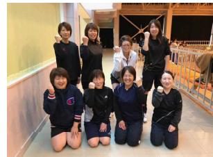
【戦いを終えて、笑顔でガッツポーズ】

11月12日、若美総合体育館を会場に、市P連親善女子ソフトバレーボール大会が開催されました。本校チームは9名の少数精鋭で参加、大会出場に当たり、本番まで何度も集まり、練習を重ねました。予選リーグでは、初戦船越小に惜敗。男鹿北中・北陽小には快勝したものの、惜しくもセット率でリーグ突破はなりません。今年度は潟中学区が大会運営の当番となり、朝早く集合して準備にも汗した選手の皆様、応援に駆け付けてくださった皆様、本当にお疲れ様でした。